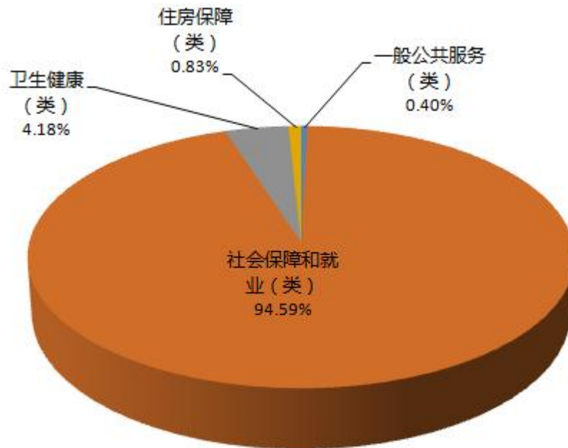
图3：财政拨款支出决算结构（按功能分类）

2020 年度财政拨款支出 1488 万元，主要用于以下方面：一般公共服务（类）支出 5.9 万元，占 0.4%；社会保障和就业（类）支出 1407.46 万元，占 94.59%；卫生健康（类）支出 62.23 万元，占 4.18%；住房保障（类）支出 12.42 万元，占 0.83%。