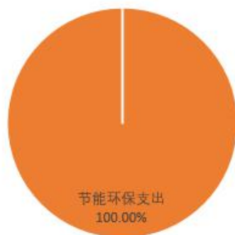
财政拨款支出决算结构（按功能分类）

2019 年度财政拨款支出 165.87 万元，主要用于以下方面比如：一般公共服务（类）支出 0 万元，占 0%；公共安全类（类）支出 0 万元，占 0%；教育（类）支出 0 万元，占 0%；科学技术（类）支出 0 万元，占 0%；社会保障和就业（类）支出 0 万元，占 0%；住房保障（类）支出 0 万元，占 0%；节能环保（类）支出 165.87 万元，占 100%。